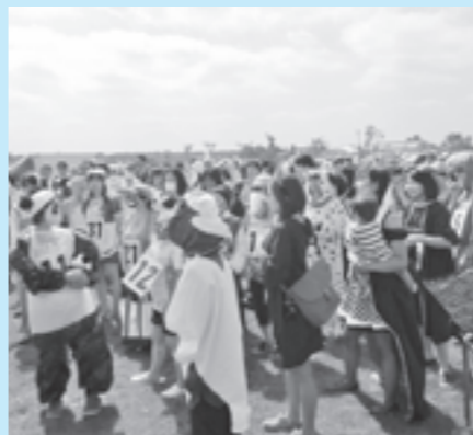
仮装披露大会参加者