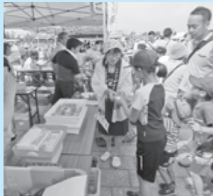
女性部いも焼き無料配布