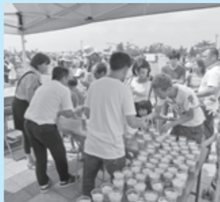
チャリティーそめん・豆腐そうめん配布