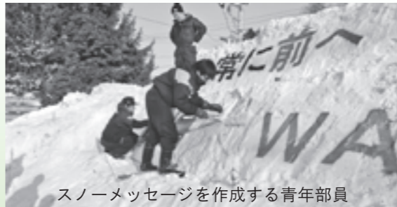
スノーメッセージを作成する青年部員

※スノーメッセージとは、空知管内の各青年部が自然を有効に活用し安全・安心な農畜産物の生産にかける農業者の心意気を消費者にアピールすることを目的に作成しています。本年度は統一テーマ『挑戦』として取組んでいます。